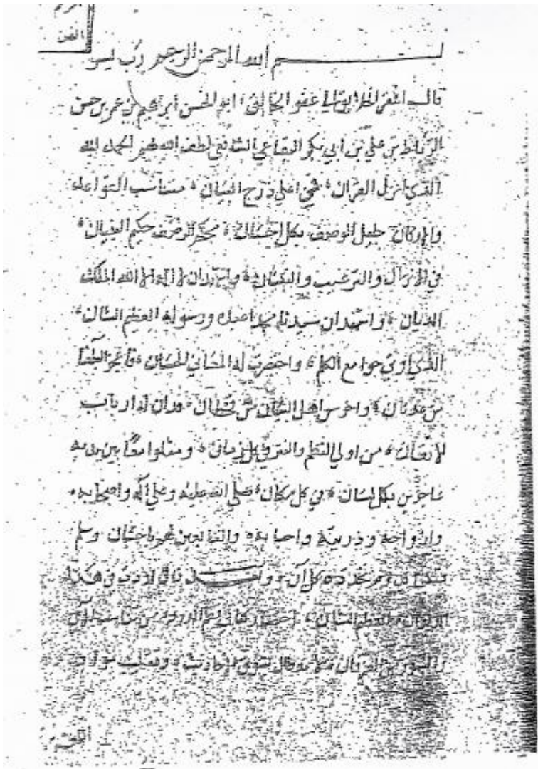
لوحة رقم (٤)

تمثل الصفحة الأولى من نسخة جامعة إستانبول