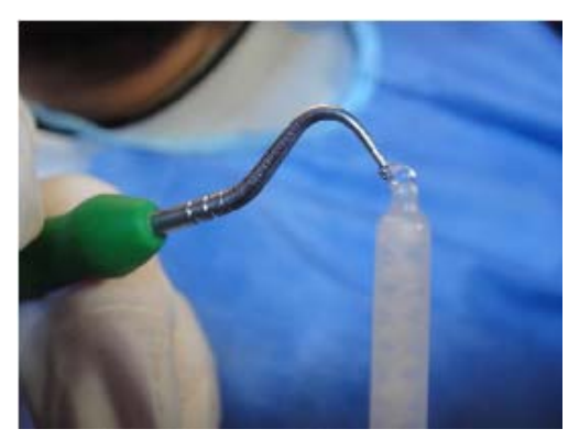
الشكل 5: تطبيق هلام Carisolv