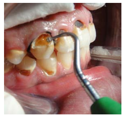
الشكل 6: تجريف النخر بالمجارف الملحقة بنظام Carisolv