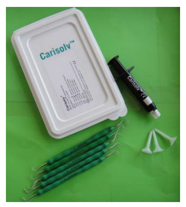
Carisolv ^{\text{TM}} الشكل 4: نظام تجريف النخر