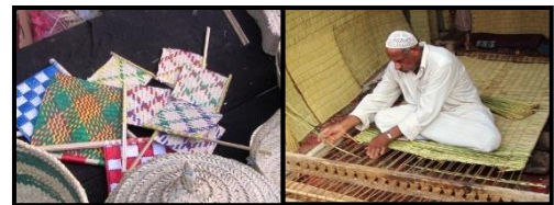
شكل رقم (4) حرفة الحصير https://cutt.us/5y4jt

ويمكن القول بأن الحرفي الشعبي ذو صلة كبيرة ببيئته الطبيعية فهو "يستخرج مواد حرفته من البيئة الزراعية أو الصحراوية أو الساحلية ولقد عاش أفراد المجتمع مكتفين اكتفاءً ذاتياً بمنتجات البيئة ووظفوا كل ما يقع في أيديهم لمطالب حياتهم اليومية". (الوحميد، 2011، ص1) فنجد مثلاً في حرفة صناعة الخوص أن النخلة تمثل الأساس فيها حيث إن النخيل يمثل أهمية كبيرة في الأحساء ومن خلال موادها الأساسية كالسعف تقوم هذه الحرفة من خلال جمع السعف أخضر ويقوم الصانع باستخدامه في عمل الحصير والمراوح اليدوية وغيرها. شكل (4)