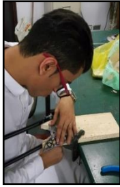
شكل رقم (11) التشكيل بالتفريغ (من تصوير الباحثين أثناء التجربة)

يعتبر الصاج من الخامات الرخيصة ويتميز بأن "معامل انكساره قليل لأن سطحه غير لامع وبنفاذية الضوء للصاج معدومة، كما أن خاصية التوصيل للحرارة جيدة لذا يتم عمل الأدوات المنزلية منه ومن أهم خواصه قابليته للتشكيل مثل عمليات الطرق والقطع". (غانم، 1985، ص16) ويوجد منه نوعان الصاج الأسود والصاج المجلفن ولقد تم الاستعانة بالصاج المجلفن وهو عبارة عن ألواح من الصاج الأسود المطلي بطبقة من الزنك لإكسابه مقاومة للصدأ كما يكسبه بريقاً مميزاً ويمتاز باللدونة ويسهل لحامه بالقصدير والفضة.