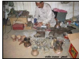
شكل رقم (6) حرفة الحدادة https://cutt.us/No8an

والحديث لا ينتهي عن الحرف والصناعات التراثية في الأحساء فهناك العديد من الصناعات والحرف الشعبية المهمة والمستمدة من الإرث الحضاري والبيئي، ونتيجة لهذا الزخم التراثي والثقافي فلقد امتلكت الأحساء عضوية في شبكة المدن الإبداعية بمنظمة اليونسكو فيما يخص المجال الإبداعي الخاص بالحرف اليدوية والفنون الشعبية منذ عام 2015، وهي ثالث المدن العربية انضماماً للقائمة وأولها خليجياً، وهذا الاختيار كان نتيجة اهتمام الأحساء بمجال الحرف اليدوية والفنون الشعبية واعتبارها عاملاً استراتيجياً نحو تحقيق تنمية مستدامة في المجالات الاقتصادية والاجتماعية والثقافية والبيئية.