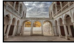
شكل رقم (3) المدرسة الأميرية https://cutt.us/ulzNO

وتأكيداً على علاقة الفن بالبيئة سنجد أن "تاريخ الفكر الفلسفي زاخر