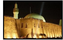
شكل رقم (2) قصر إبراهيم https://cutt.us/bHRxw

هذا كله يعد بمثابة إرث حضاري بالمنطقة، ولقد انعكس على طبيعة وثقافة سكان الأحساء حيث إن هذا التنوع الكبير في الطبيعة والتراث في المنطقة كان دافعاً للحرفي والفنان لأن يكون له سماته الخاصة وطابعه الفني الخاص والمربط بطبيعة المنطقة ولذلك نجد أن الأحساء تتنوع بها الحرف اليدوية القائمة على خامات طبيعية موجودة في البيئة المحيطة.