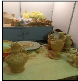
شكل رقم (5) حرفة الفخار (من تصوير الباحثين مهرجان التمور الأحساء)

كما نجد حرفة مثل الحدادة والتي قامت في الأساس لخدمة الزراعة حيث كان الاهتمام بإنتاج أدوات الزراعة ولقد اهتمت بعض الأسر هذه الحرفة وتوارثتها حتى أن هناك في الأحساء شارع مسعى بشارع (الحدادين) لكثرة من يمتنون هذه المهنة به وأيضا يشكل الحداد من مادة النحاس القدرور بأحجامها المختلفة وصلفها شكل (6). ونجد حرفة مهمة أخرى تميزت بها الأحساء وهي حرفة الصياغة "وهي من أشهر الحرف في الأحساء ولها سوق كبيرة، فهذه الحرفة يدرك الصائغ أهميتها، فالصائغ يصوغ من سبائك الذهب والفضة العديد من الأشكال الهندسية وزينها بالأحجار الكريمة والجواهر ويستخرج من هذه السبائك ما تلبسه المرأة وتتجمل به في حياتها ومن أهم ما يصنعه الصائغ المهمة والحجول والخواتم والأساور والقلائد". (الوحميد، 2011، ص5) شكل (7)