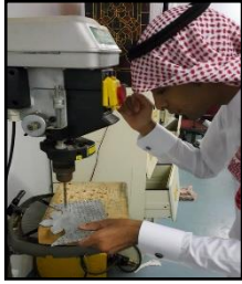
شكل رقم (9) الثقب بالمنقاب الكهربائي

في الثقب وتوزع هذه الثقوب على سطح المشغولة في تصميمات مختلفة سواء بشكل حر أو على شبكيات منتظمة أفقية أو رأسية أو مائلة.