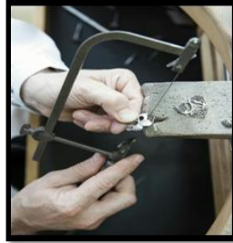
شكل رقم (10) التشكيل بالتفريغ