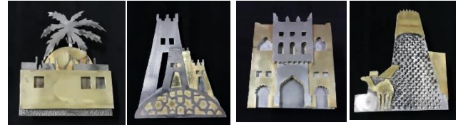
شكل (13) عمل الطالب عدنان الجاري شكل (14) عمل الطالب أحمد البخيتان شكل (15) عمل الطالب موسى الفجري شكل (16) عمل الطالب صالح الصبي

المجموعة الأولى: تذكارات سياحية معدنية مستوحاة من تراث العمارة في الأحساء.