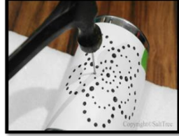
شكل رقم (8) الثقب بالسنيك https://pin.it/d5jimiaumyz35k

"وهو سبيكة تتكون من خليط من النحاس والزنك لم تعرف إلا في عصر متأخر بالنسبة لتاريخ المعدن ومع ذلك فقد عرفت قبل اكتشاف فلز الزنك الخالص بعد مئات السنين ولذلك لا بد وأن يكون النحاس الأصفر قد أنتج لأول مرة من خليط من خام النحاس والزنك" (حسن، 1985، ص29) ومن أهم خواصه أنه أصفر اللون وتتفاوت خواصه بتفاوت نسبة الفلزين ويوجد على هيئة ألواح، شبك، أسلاك، مواسير، أنابيب، مسبوكات، والنحاس الأصفر سهل التشغيل واللحام والطرق وهو مقاوم جيد للتآكل وموصل جيد للحرارة والكهرباء.