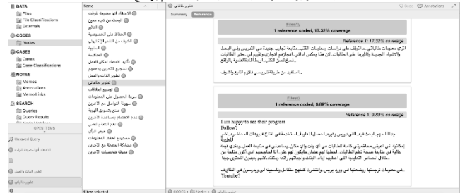
الشكل (1): الترميزات الأولية لبيانات البحث باستخدام برنامج NVivo

وخلال المرحلة الثالثة قامت الباحثتان بإعادة قراءة مقاطع كل رمز والتأكد من أنه تم ترميزها بشكل صحيح. في غضون ذلك، بحثتا عن اتصالات بين الرموز ونتيجة لهذا البحث قامت بإعادة تسمية بعض الرموز، ودمج الرموز المتشابهة، وربط بعض الرموز برموز أخرى وبالتالي كوننا مجموعات من الرموز تسمى موضوعات Themes لها ارتباط وثيق بأسئلة البحث.