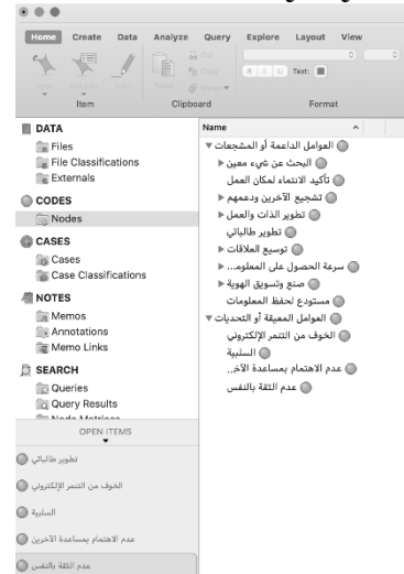
الشكل (3): ترتيب جميع المواضيع الرئيسية Main Themes والترميزات Nodes المندرجة تحتها

في هذا البحث، تم استخدام NVivo، الإصدار 12 (QSR International,